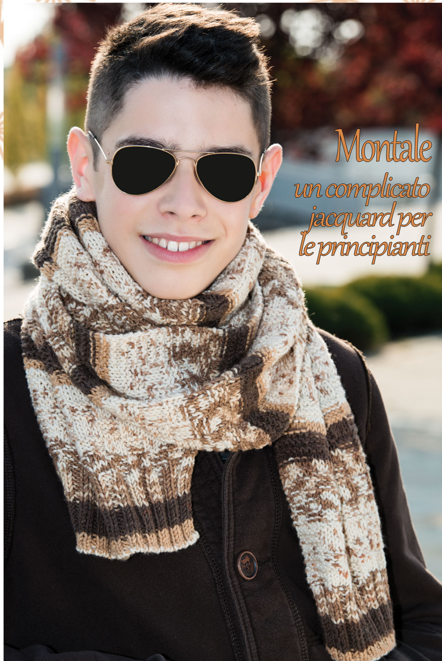
Montale un complicato jacquard per le principianti