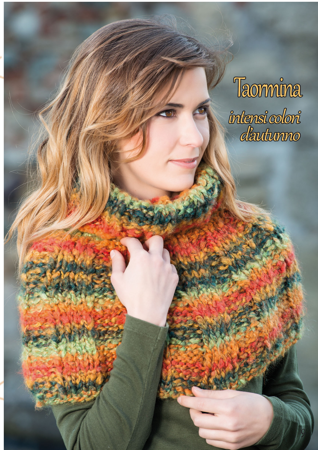
Taormina intensi colori d'autunno